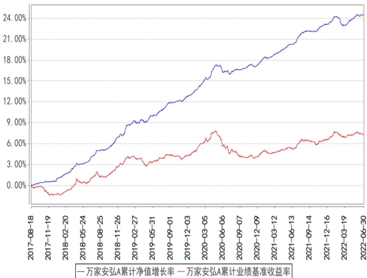
万家安弘A累计净值增长率与同期业绩比较基准收益率的历史走势对比图

(二) 自基金合同生效以来基金累计净值增长率变动及其与同期业绩比较基准收益率变动的比较(自基金合同日至2022年06月30日)