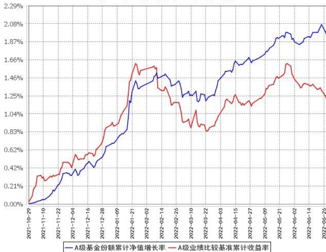
A级基金份额累计净值增长率与同期业绩比较基准收益率的历史走势对比图 (2021年10月29日至2022年6月30日)