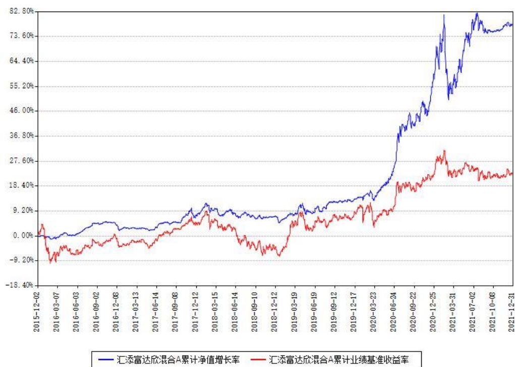
汇添富达欣混合A累计净值增长率与同期业绩基准收益率对比图