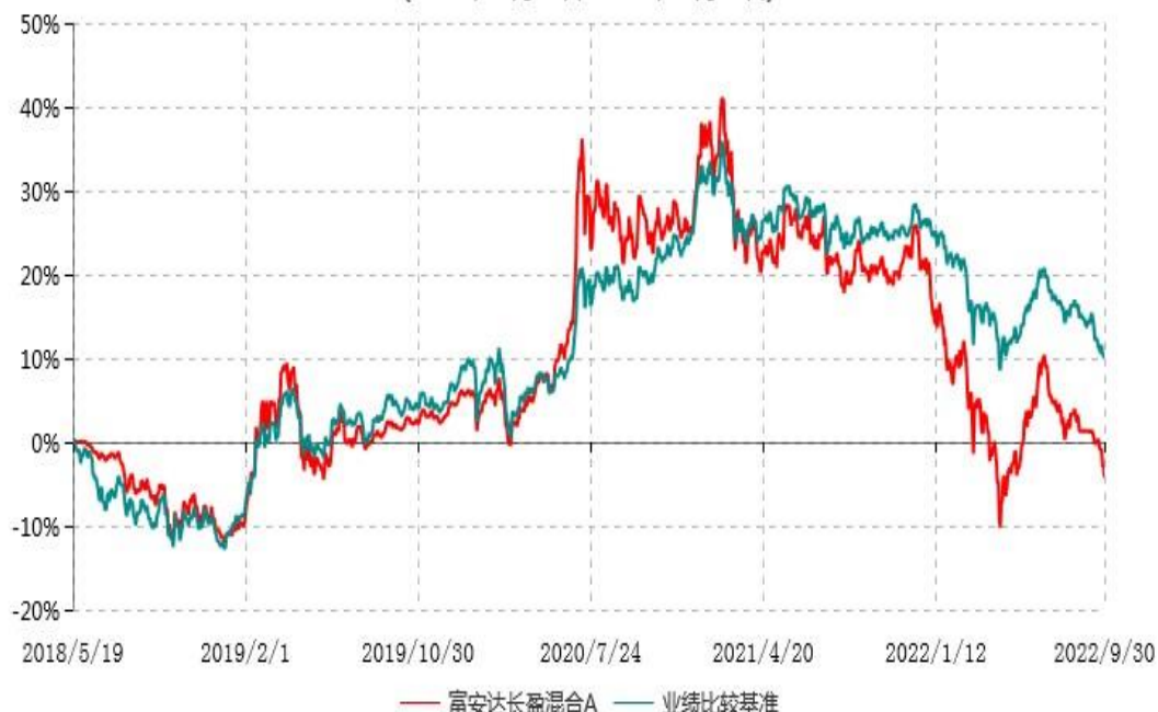
富安达长盈混合A累计净值增长率与业绩比较基准收益率历史走势对比图 (2018年05月19日-2022年09月30日)