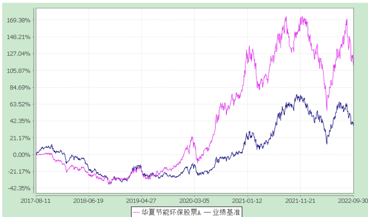
华夏节能环保股票 C: