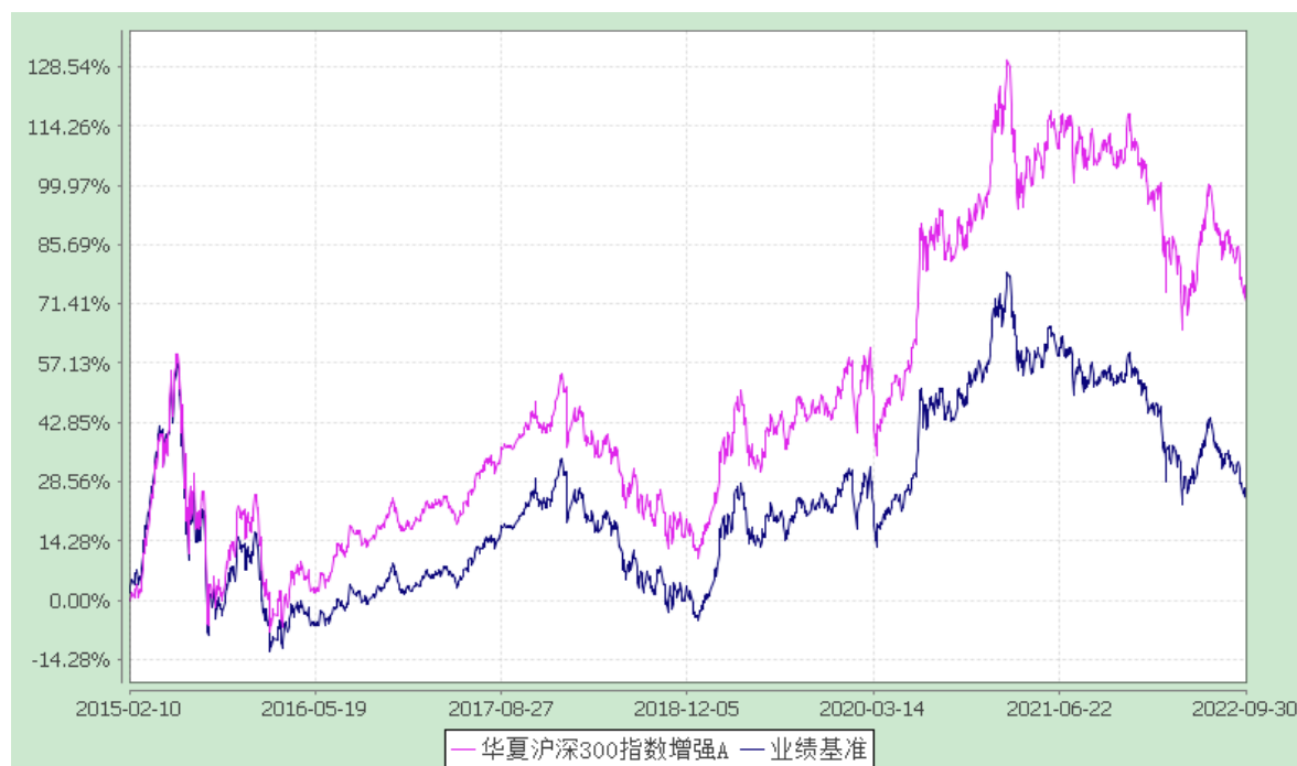
华夏沪深 300 指数增强 C: