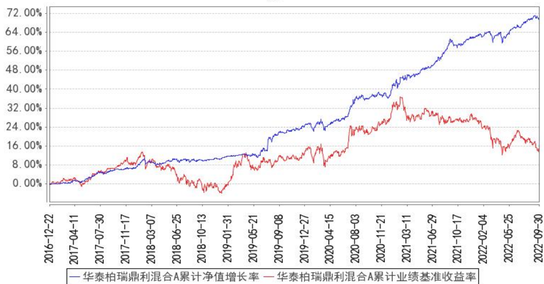
华泰柏瑞鼎利混合A累计净值增长率与同期业绩比较基准收益率的历史走势对比图