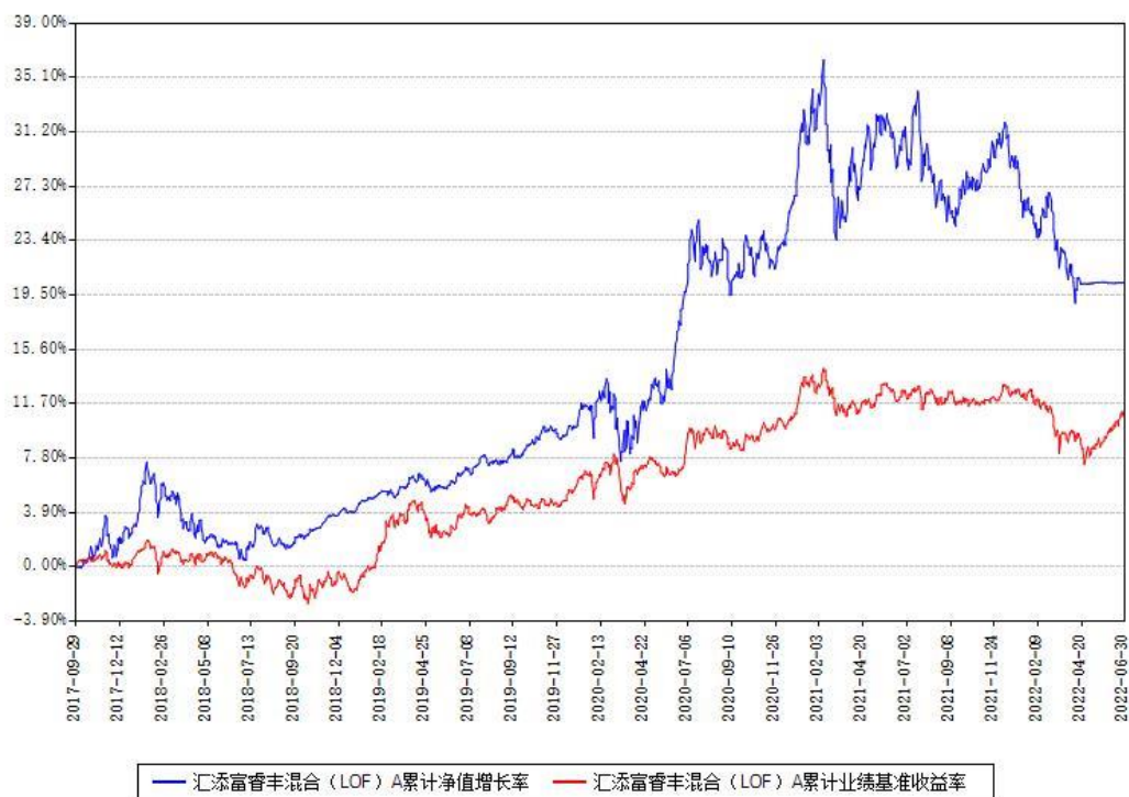
汇添富睿丰混合（LOF）A累计净值增长率与同期业绩基准收益率对比图

(二)自基金合同生效以来基金累计净值增长率变动及其与同期业绩比较基准收益率变动的比较图