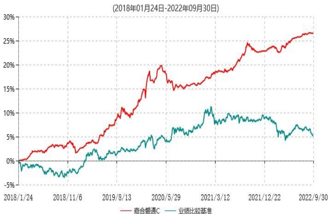
嘉合磐通C累计净值增长率与业绩比较基准收益率历史走势对比图