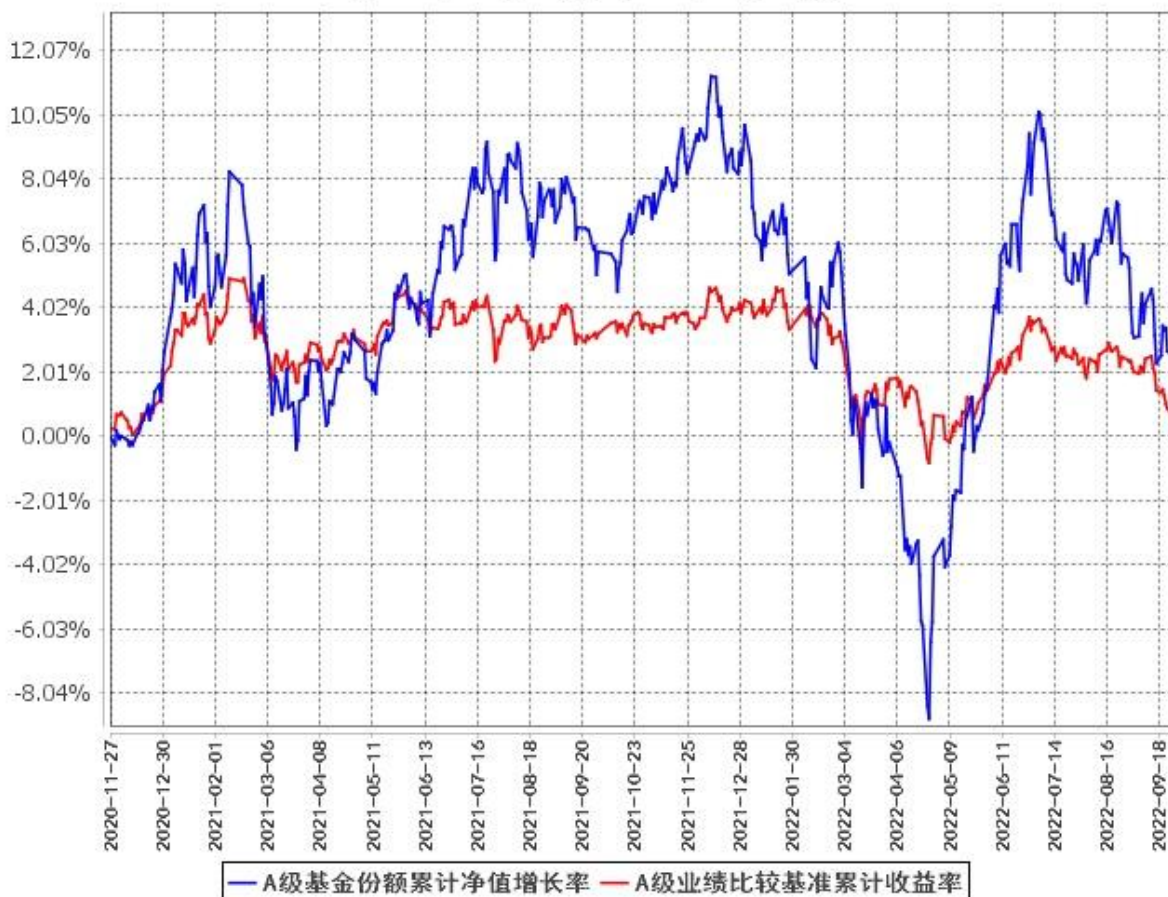
A级基金份额累计净值增长率与同期业绩比较基准收益率的历史走势对比图 (2020年11月27日至2022年9月30日)