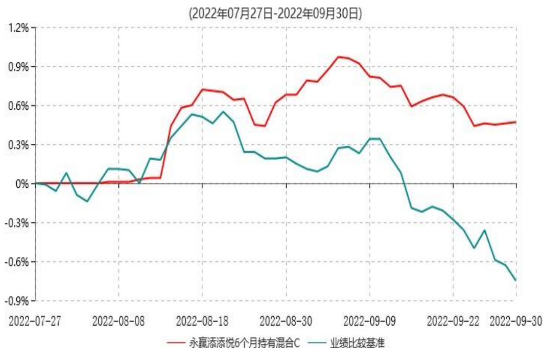
永赢添添悦6个月持有混合C累计净值增长率与业绩比较基准收益率历史走势对比图

注：1、本基金合同生效日为2022年7月27日，截至本报告期末本基金合同生效未满一年；