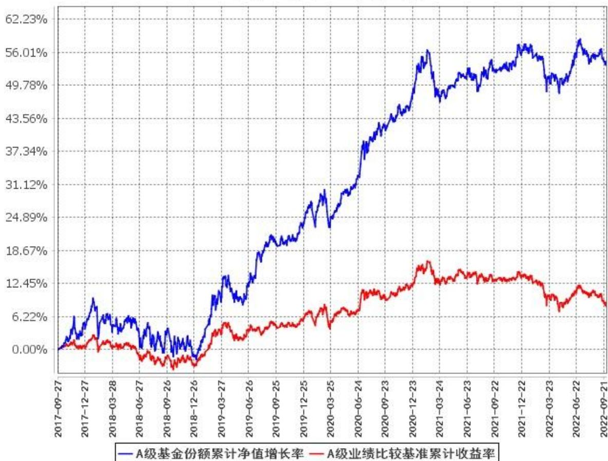
A级基金份额累计净值增长率与同期业绩比较基准收益率的历史走势对比图 (2017年9月27日至2022年9月30日)