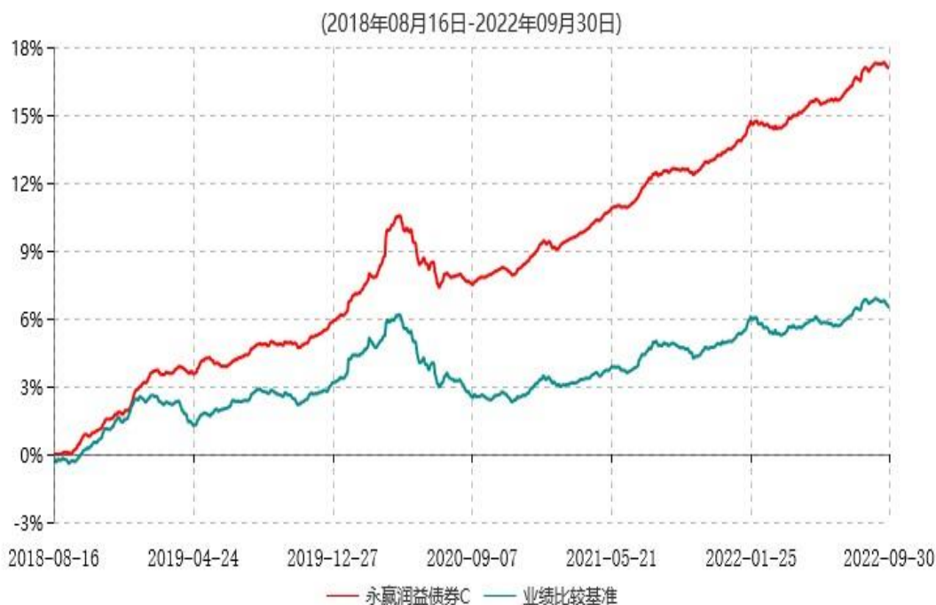
永赢润益债券C累计净值增长率与业绩比较基准收益率历史走势对比图