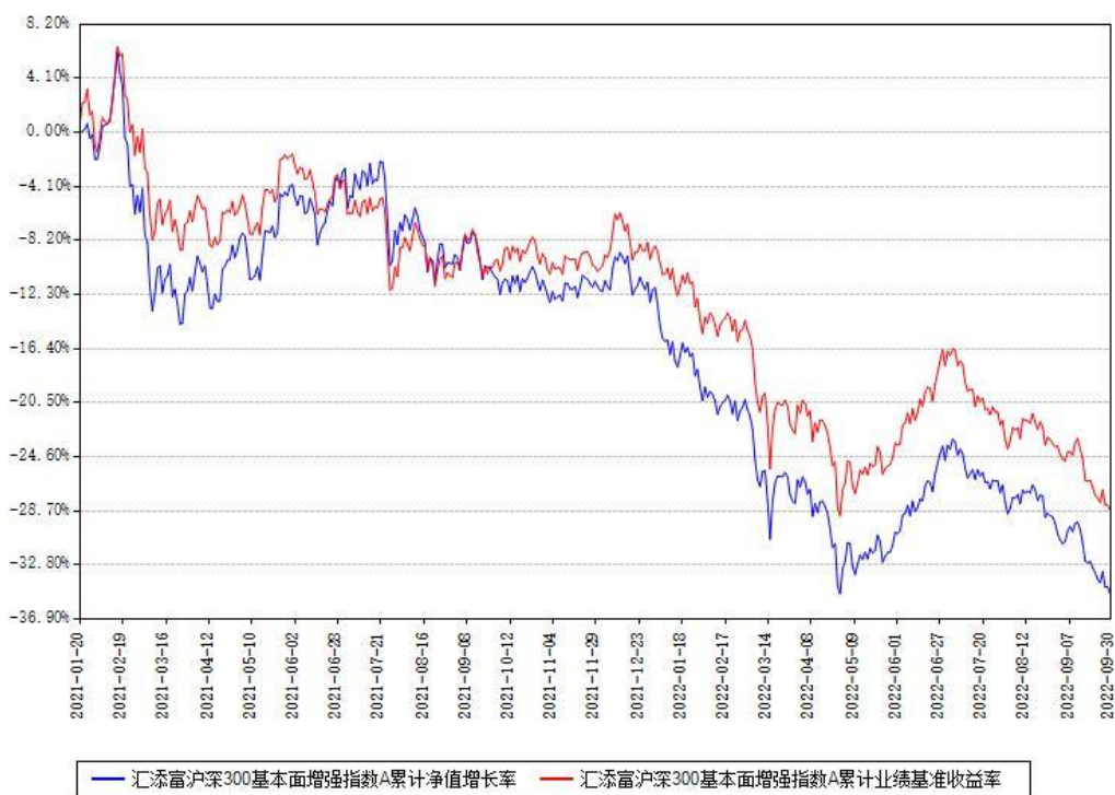
汇添富沪深300基本面增强指数A累计净值增长率与同期业绩基准收益率对比图