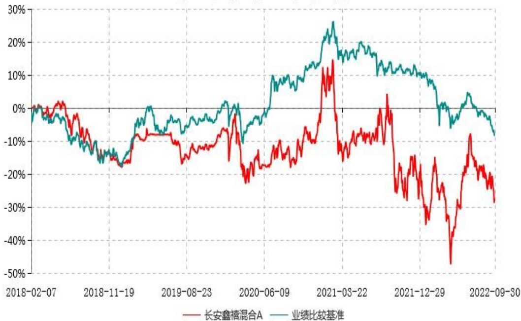
长安鑫禧混合A累计净值增长率与业绩比较基准收益率历史走势对比图 (2018年02月07日-2022年09月30日)

根据基金合同的规定,自基金合同生效之日起 6 个月内基金各项资产配置比例需符合基金合同要求。本基金在建仓期结束后,各项资产配置比例已符合基金合同有关投资比例的约定。图示日期为 2018 年 02 月 07 日至 2022 年 09 月 30 日。