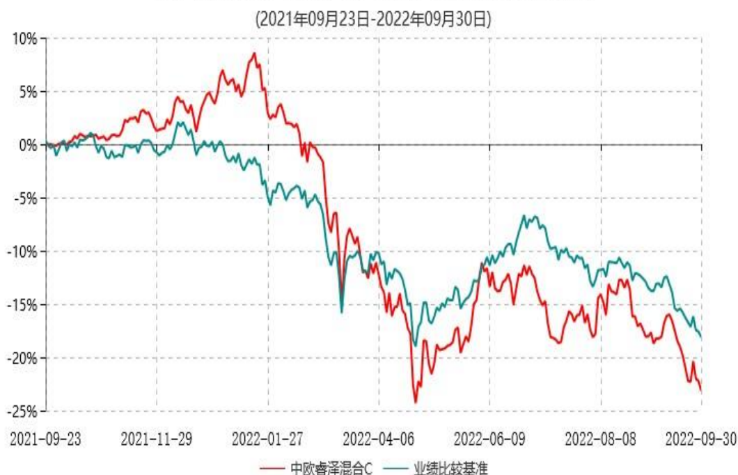
中欧睿泽混合C累计净值增长率与业绩比较基准收益率历史走势对比图

注：本基金基金合同生效日期为 2021 年 9 月 23 日，按基金合同的规定，本基金自基金合同生效起六个月为建仓期，建仓期结束时各项资产配置比例已符合基金合同约定。