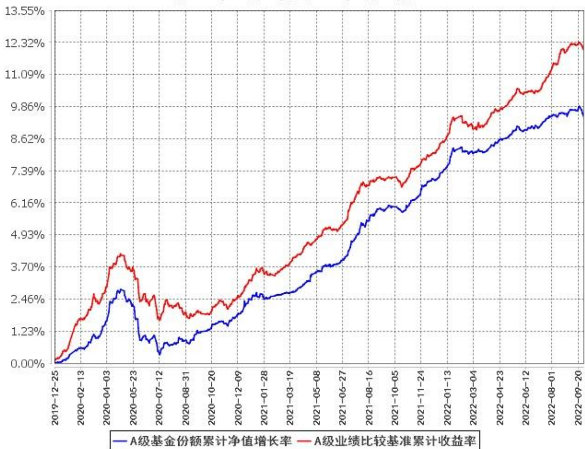
A级基金份额累计净值增长率与同期业绩比较基准收益率的历史走势对比图 (2019年12月25日至2022年9月30日)