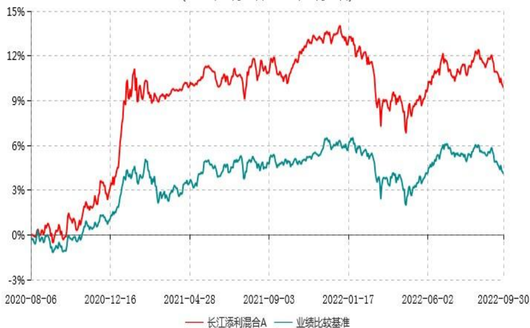
长江添利混合A累计净值增长率与业绩比较基准收益率历史走势对比图 (2020年08月06日-2022年09月30日)