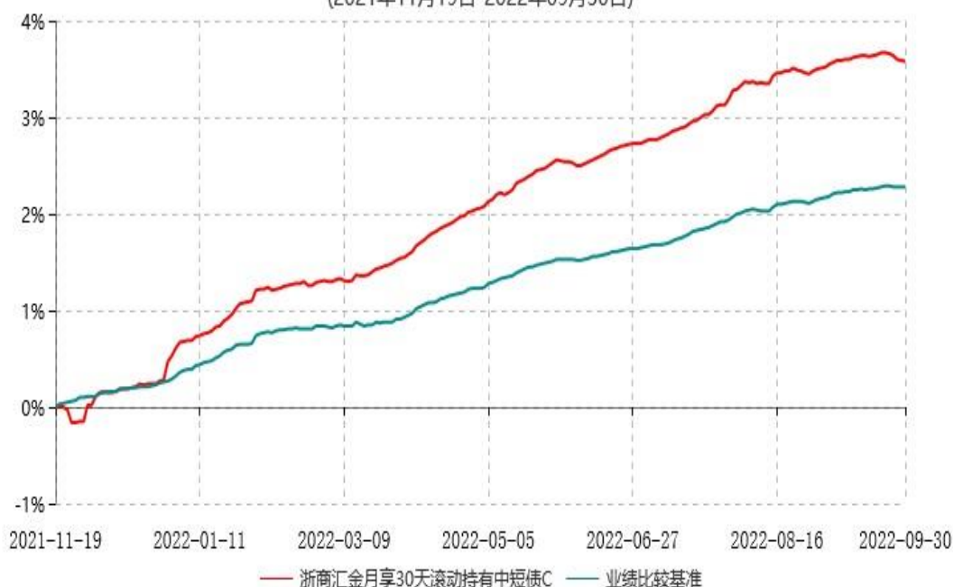
浙商汇金月享30天滚动持有中短债C累计净值增长率与业绩比较基准收益率历史走势对比图 (2021年11月19日-2022年09月30日)

注：本基金合同生效日为 2021 年 11 月 19 日，自基金合同生效日起至本报告期末不满一年。至本报告期末，本基金已完成建仓。建仓期为 2021 年 11 月 19 日-2022 年 5 月 18 日，但报告期末距建仓结束不满一年，建仓期结束时各项资产配置比例符合合同约定。