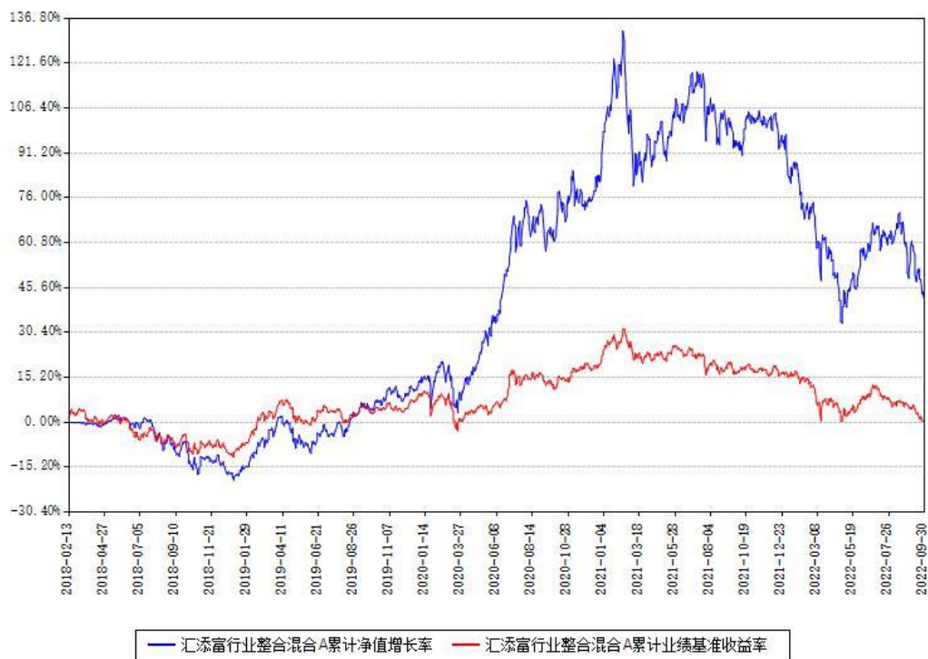
汇添富行业整合混合A累计净值增长率与同期业绩基准收益率对比图