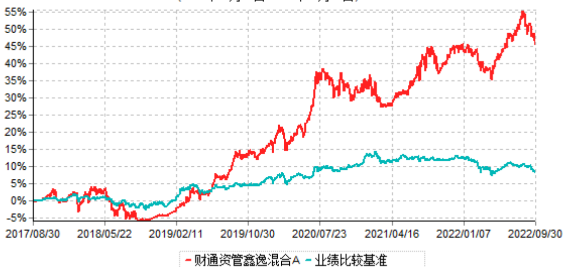
财通资管鑫逸混合A累计净值增长率与业绩比较基准收益率历史走势对比图 (2017年08月30日-2022年09月30日)