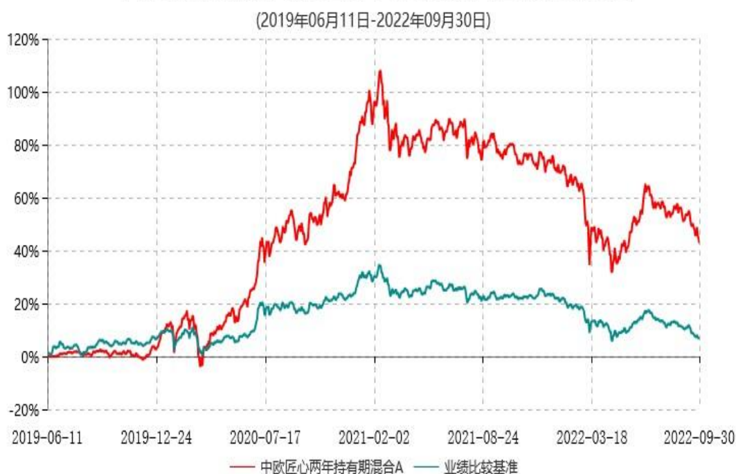
中欧匠心两年持有期混合A累计净值增长率与业绩比较基准收益率历史走势对比图