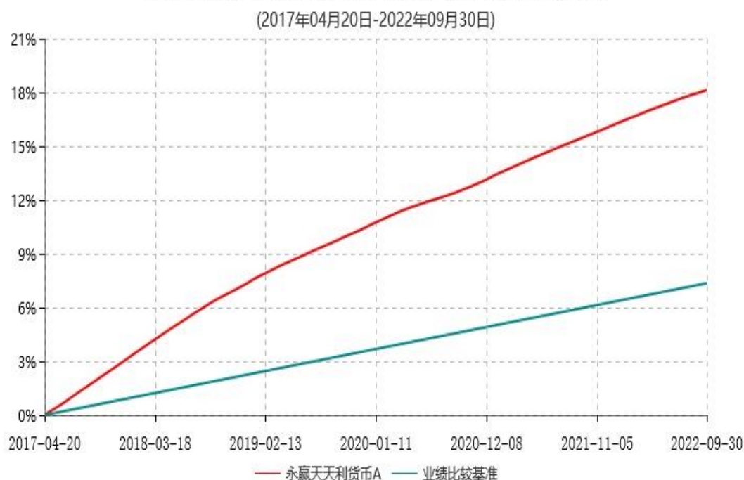
永赢天天利货币A累计净值收益率与业绩比较基准收益率历史走势对比图