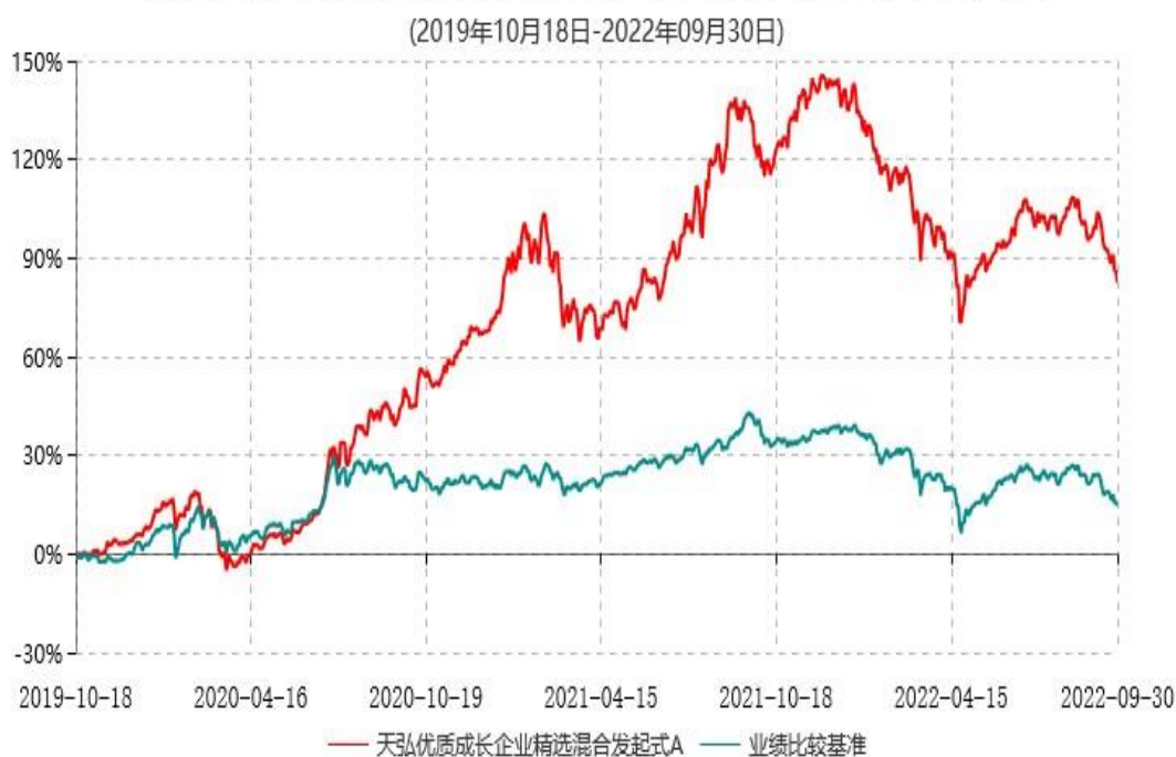
天弘优质成长企业精选混合发起式A累计净值增长率与业绩比较基准收益率历史走势对比图