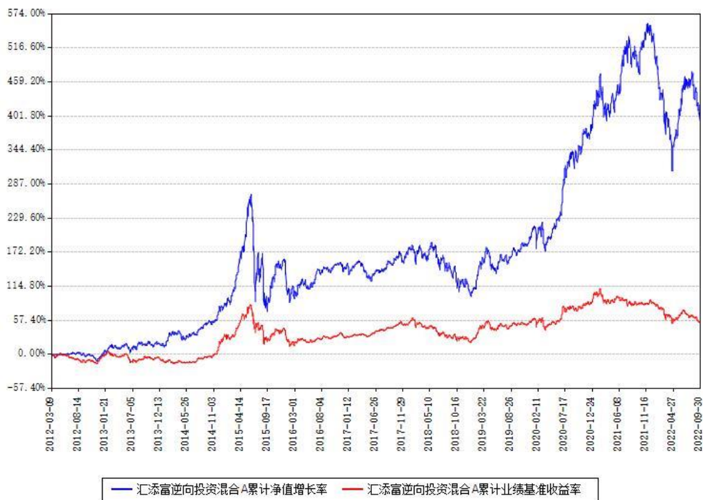
汇添富逆向投资混合A累计净值增长率与同期业绩基准收益率对比图