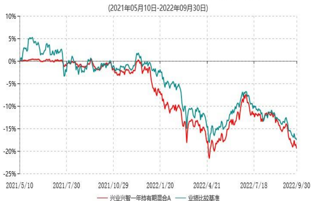
兴业兴智一年持有期混合A累计净值增长率与业绩比较基准收益率历史走势对比图