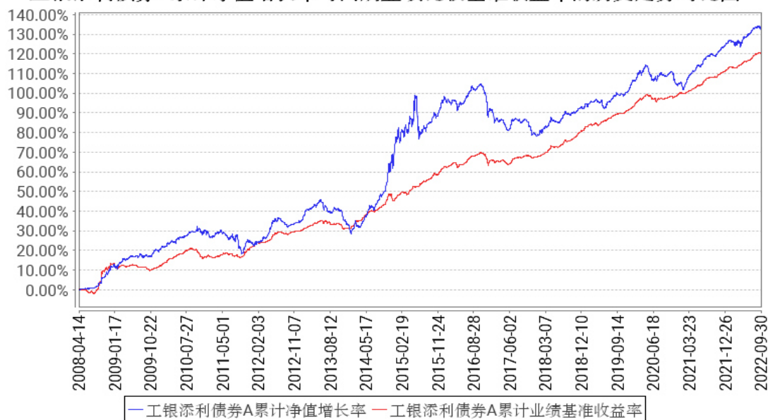
工银添利债券A累计净值增长率与同期业绩比较基准收益率的历史走势对比图