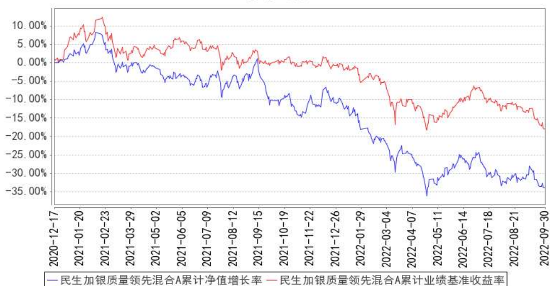
民生加银质量领先混合A 累计净值增长率与同期业绩比较基准收益率的历史走势对比图