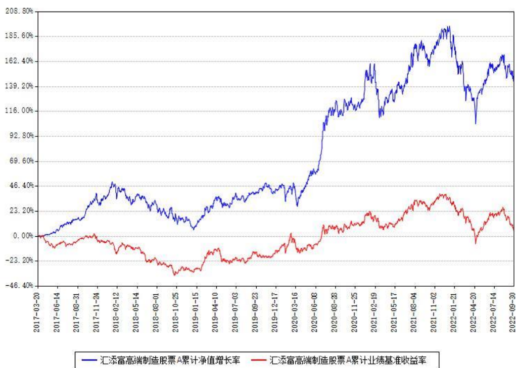
汇添富高端制造股票A累计净值增长率与同期业绩基准收益率对比图