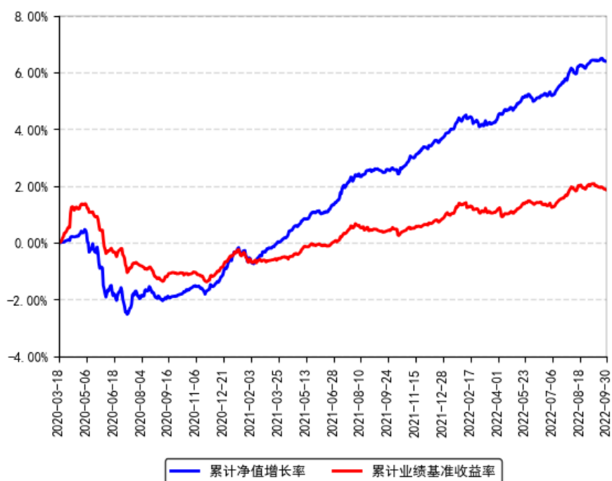
南方乐元中短期利率债券A累计净值增长率与同期业绩比较基准收益率的历史走势对比图