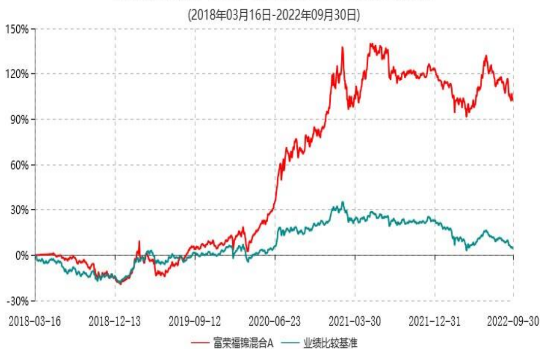
富荣福锦混合A累计净值增长率与业绩比较基准收益率历史走势对比图