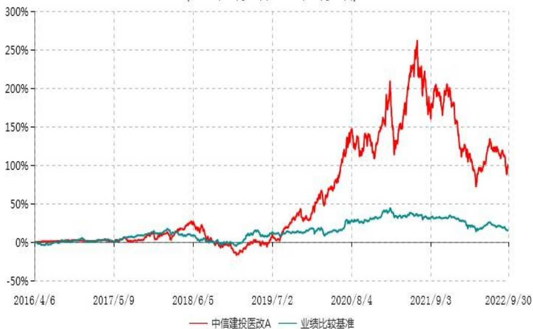
中信建投医改A累计净值增长率与业绩比较基准收益率历史走势对比图 (2016年04月06日-2022年09月30日)