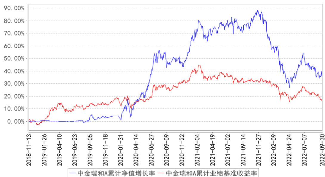
中金瑞和A累计净值增长率与同期业绩比较基准收益率的历史走势对比图