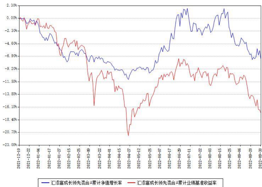
汇添富成长领先混合C累计净值增长率与同期业绩基准收益率对比图