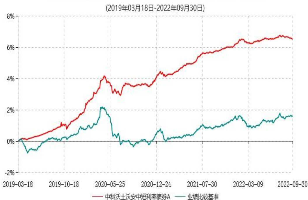
中科沃土沃安中短期利率债券A累计净值增长率与业绩比较基准收益率历史走势对比图