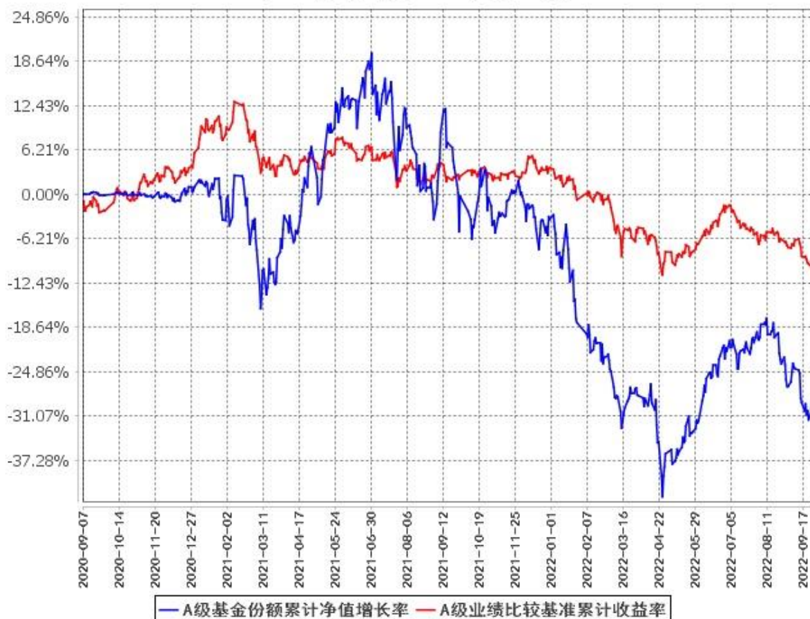
A级基金份额累计净值增长率与同期业绩比较基准收益率的历史走势对比图 (2020年9月7日至2022年9月30日)