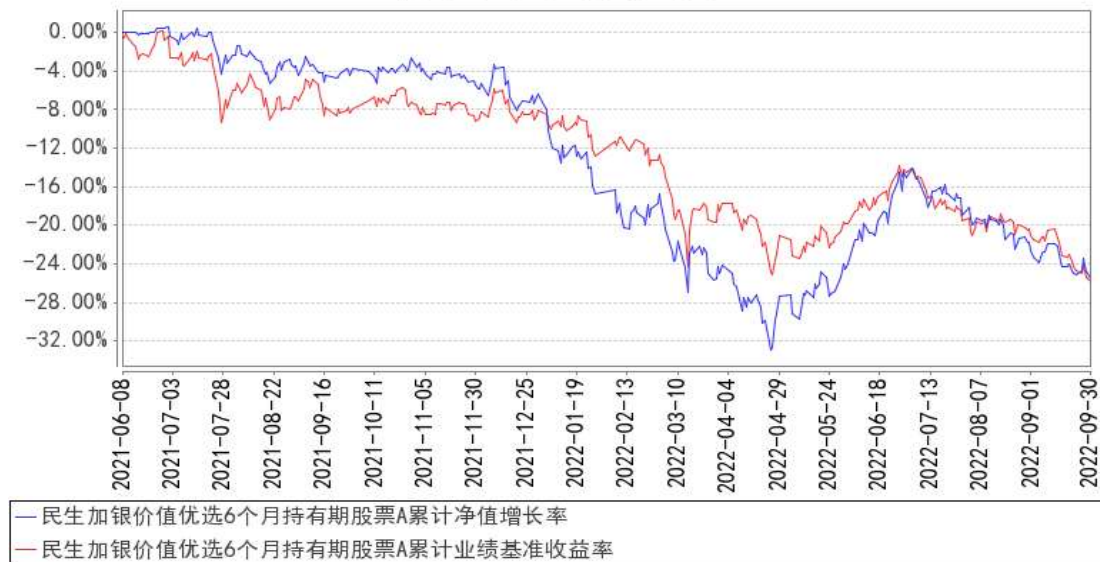
民生加银价值优选 6 个月持有期股票 A 累计净值增长率与同期业绩比较基准收益率的历史走势对比图