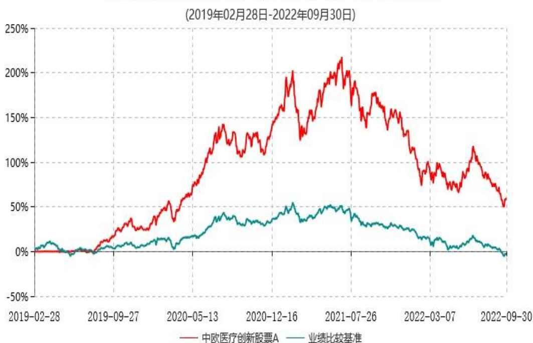
中欧医疗创新股票A累计净值增长率与业绩比较基准收益率历史走势对比图