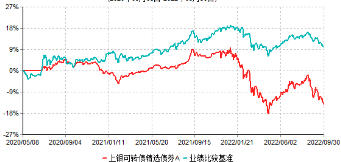
上银可转债精选债券A累计净值增长率与业绩比较基准收益率历史走势对比图 (2020年05月08日-2022年09月30日)