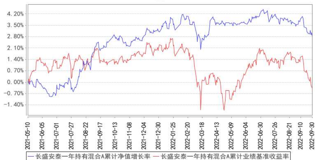
长盛安泰一年持有混合A累计净值增长率与同期业绩比较基准收益率的历史走势对比图