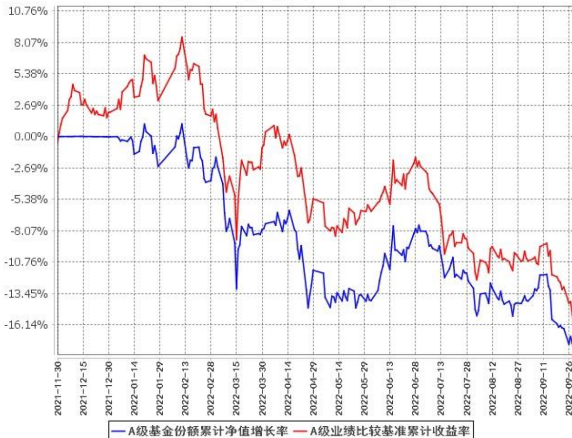
A级基金份额累计净值增长率与同期业绩比较基准收益率的历史走势对比图 (2021年11月30日至2022年9月30日)