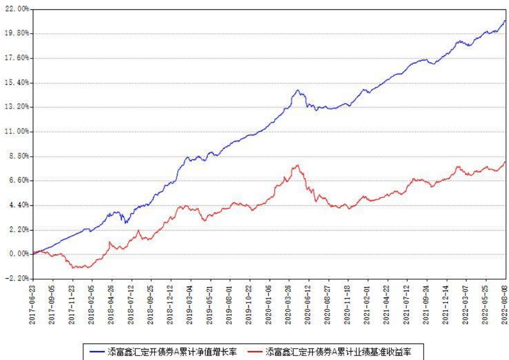
添富鑫汇定开债券A累计净值增长率与同期业绩基准收益率对比图