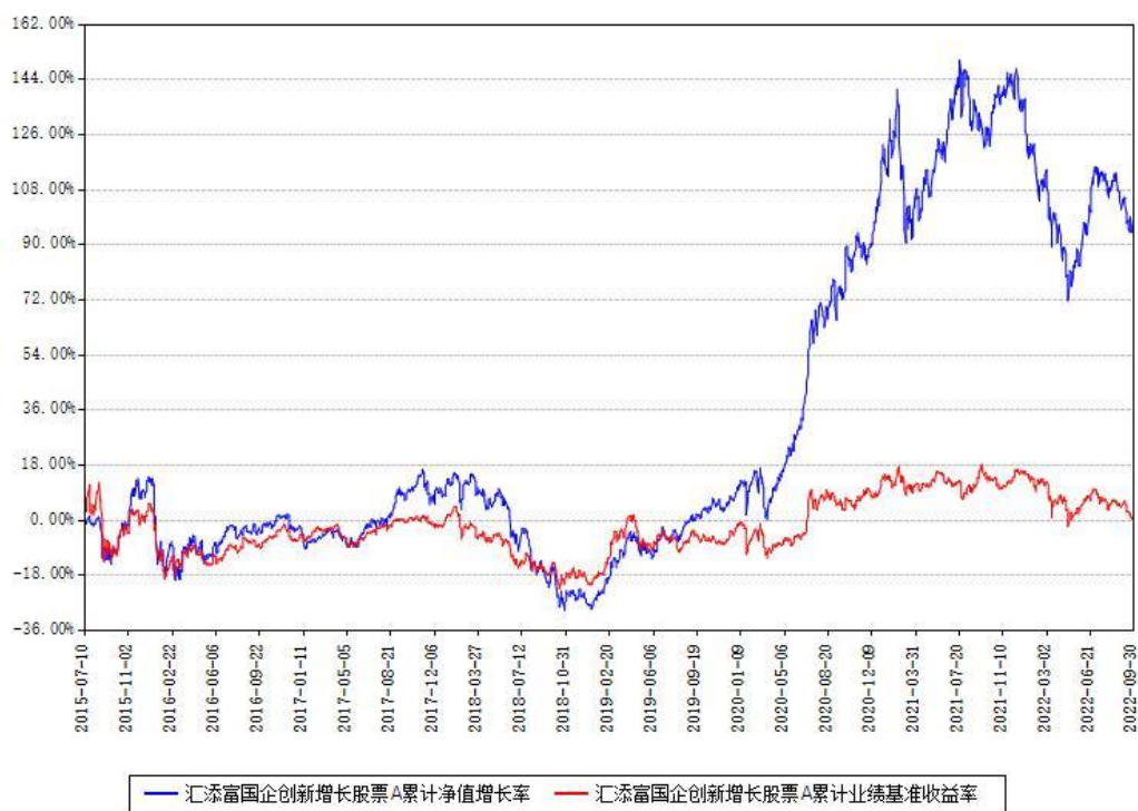
汇添富国企创新增长股票A累计净值增长率与同期业绩基准收益率对比图