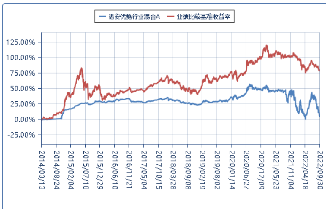
诺安优势行业混合 C