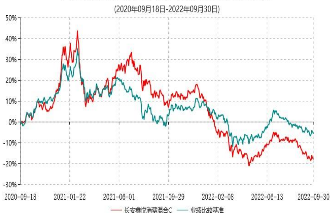
长安鑫悦消费混合C累计净值增长率与业绩比较基准收益率历史走势对比图

根据基金合同的规定,自基金合同生效之日起6个月内基金各项资产配置比例需符合基金合同要求。本基金在建仓期结束后,各项资产配置比例已符合基金合同有关投资比例的约定。本基金于2020年9月18日成立,基金合同生效日至报告期末,本基金运作时间已满一年。图示日期为2020年9月18日至2022年9月30日止。