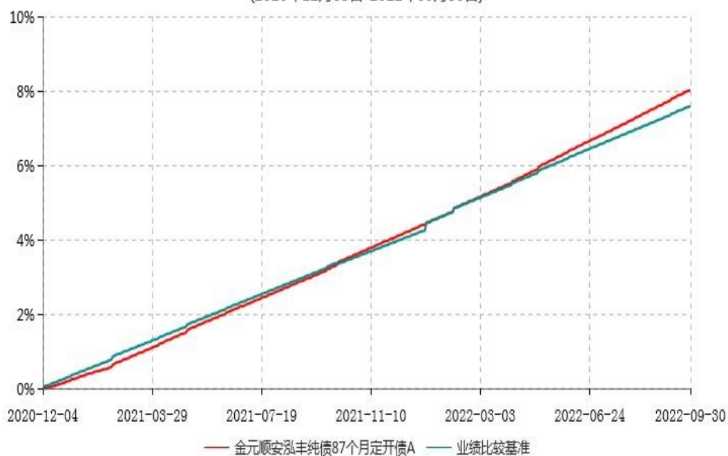
金元顺安泓丰纯债87个月定开债A累计净值增长率与业绩比较基准收益率历史走势对比图 (2020年12月03日-2022年09月30日)