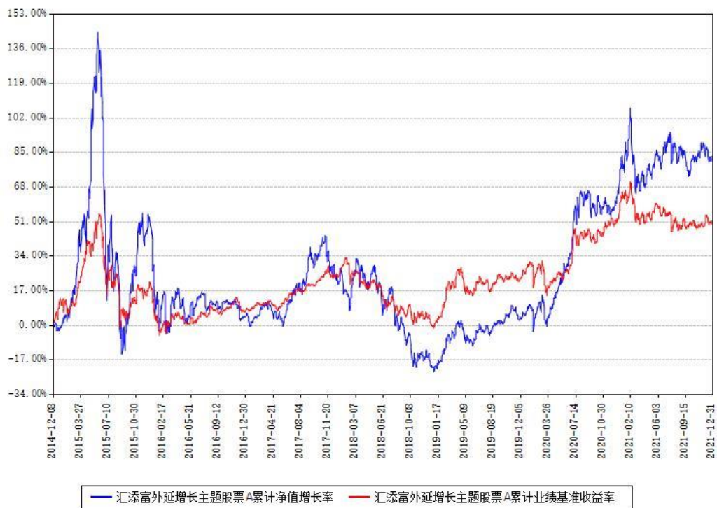
汇添富外延增长主题股票A累计净值增长率与同期业绩基准收益率对比图

(二)自基金合同生效以来基金累计净值增长率变动及其与同期业绩比较基准收益率变动的比较