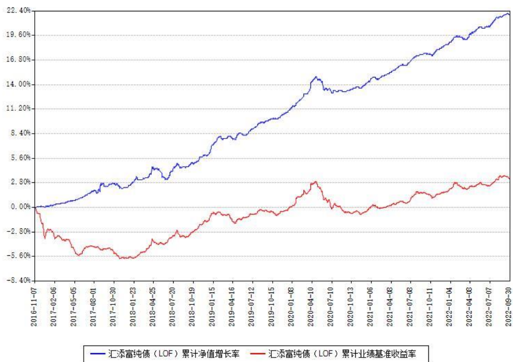
汇添富纯债 (LOF) 累计净值增长率与同期业绩基准收益率对比图