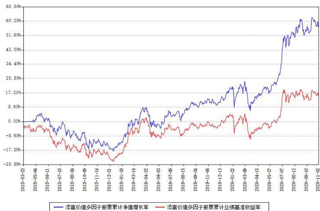
添富价值多因子股票累计净值增长率与同期业绩基准收益率对比图