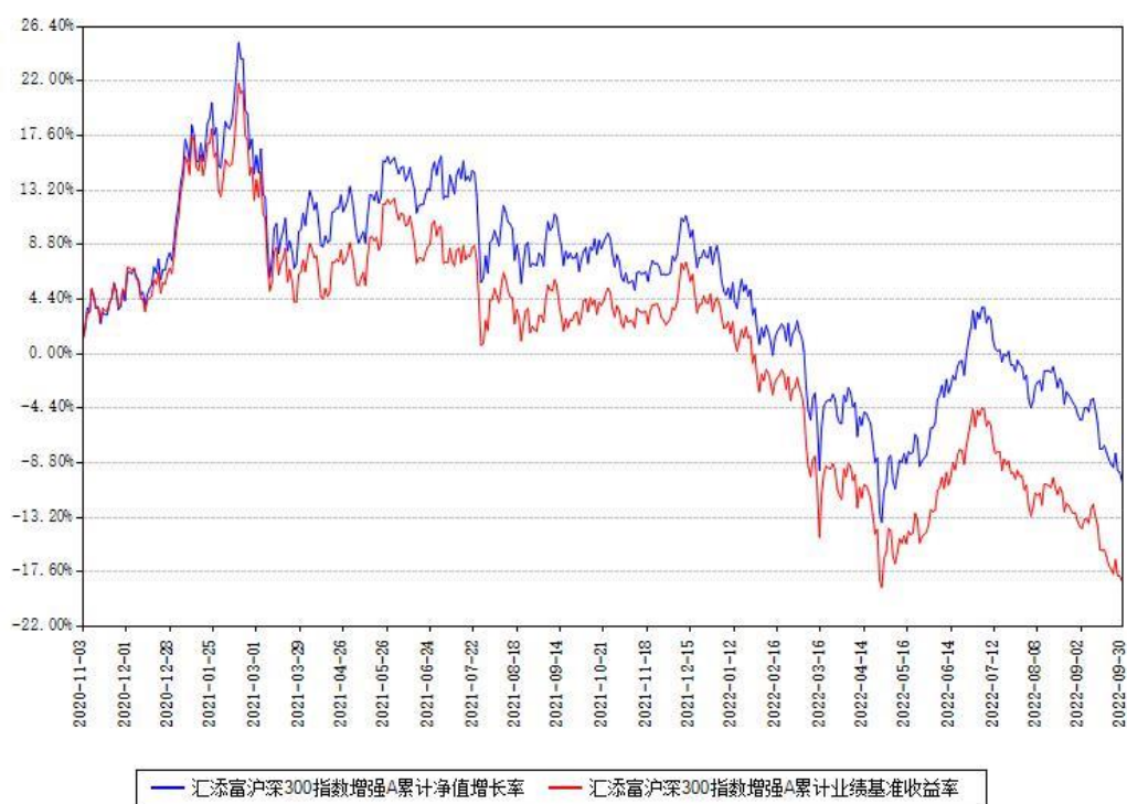
汇添富沪深300指数增强A累计净值增长率与同期业绩基准收益率对比图