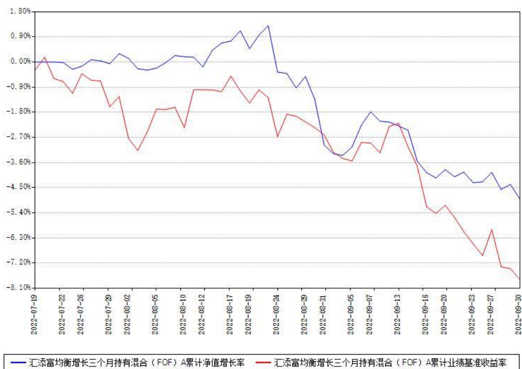
汇添富均衡增长三个月持有混合（FOF）A累计净值增长率与同期业绩基准收益率对比图